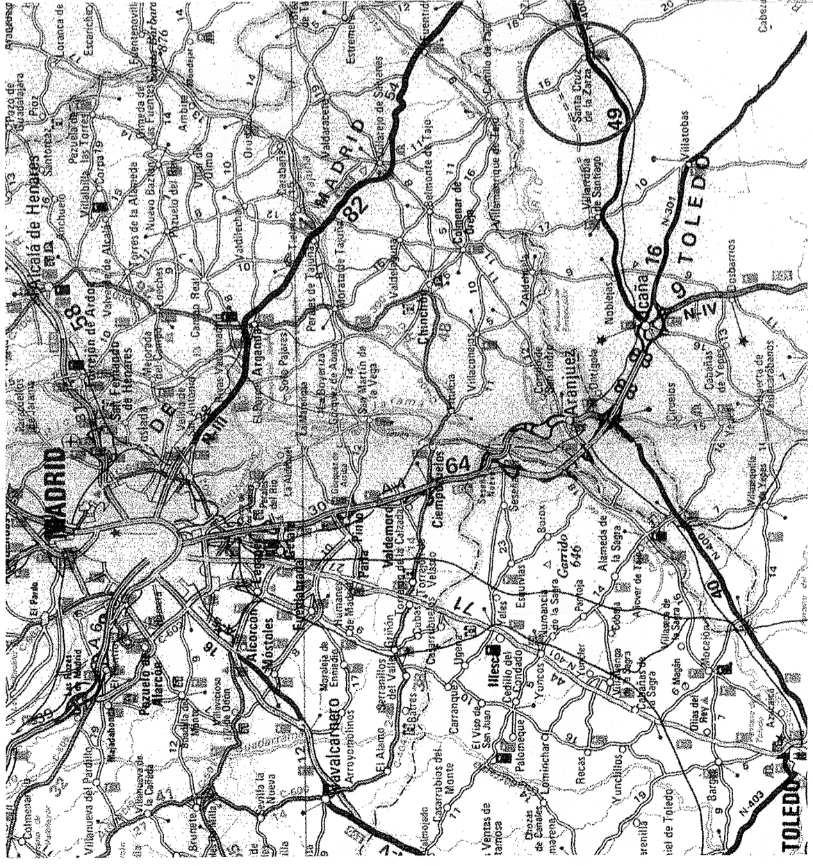
PLANTA DE LOCALIZACION